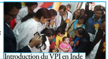
Introduction du VPI en Inde

Les deux pays où la poliomyélite est encore endémique ont désormais introduit le VPI. Pays introduisant le vaccin antipoliomyélite inactivé (VPI) dans leurs systèmes de vaccination : le Botswana, le Burundi, la Guinée, les Îles Cook, la Mauritanie, les Tuvalu, le Vanuatu et le Yémen. Plus de la moitié de la cohorte mondiale de naissances reçoit désormais au moins une dose de VPI.